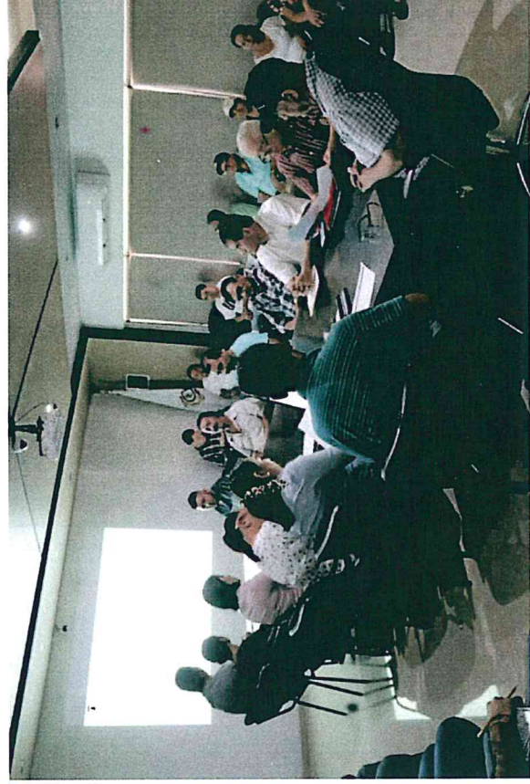
Fig. 1. Toma de asistencia de la tercera Sesión de COPLADEMUN